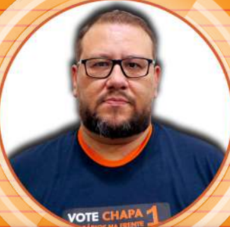
TONON BB Lençóis