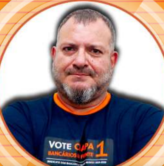
PALHARIM Bradesco 013