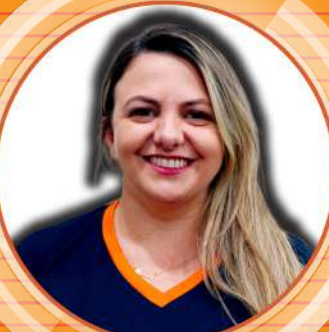
MAISA Itaú Lençóis