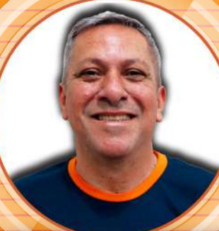
ROBER Itaú Avaré