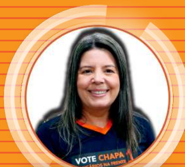
CACÃ Itaú Avaré