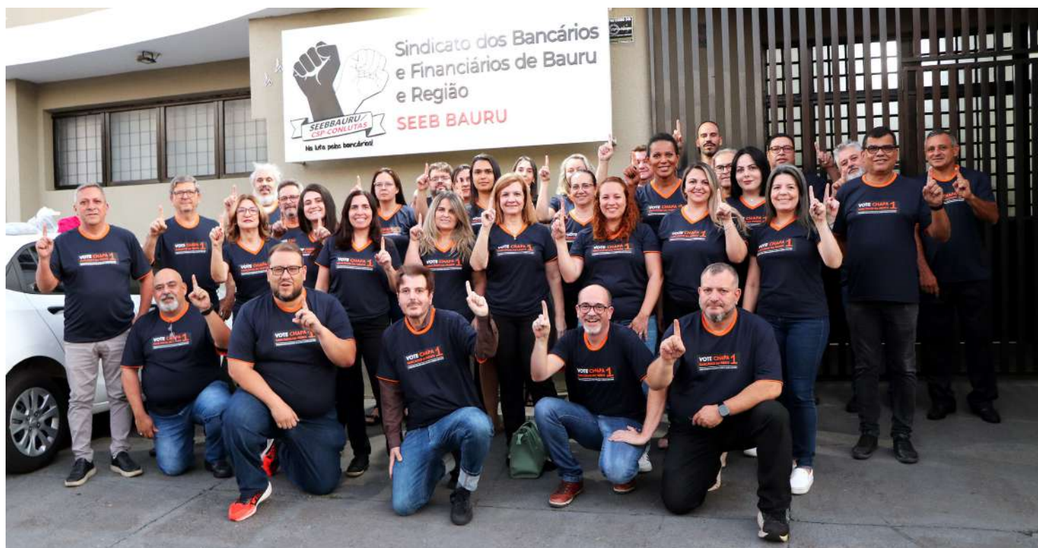
Chapa 1, formada por 33 bancários, é exemplo de representatividade e diversidade, composta por trabalhadores de bancos públicos e privados, comprometidos com a luta da categoria bancária.

A parceria com os Sindicatos do RN e MA também continuarão, assim como a construção de uma mesa de negociação para a FNOB (Frente Nacional de Oposição Bancária) e a ajuda na construção de chapas de oposição a direção da Contraf/CUT em todo o País.