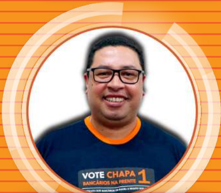
CHOCO Santander Avaré