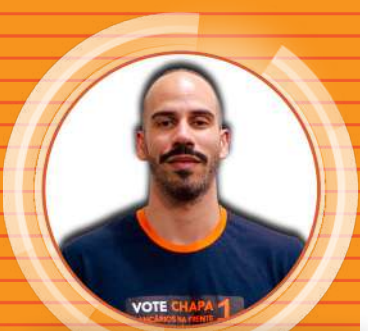
BRUNÃO BB Escritório Digital