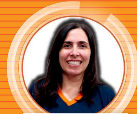
ARIANE BB Escritório Leve