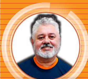
ED Caixa Avaré