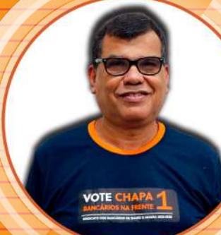
ODAYR BB P50