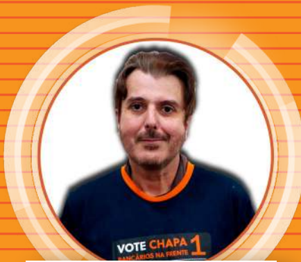
BETO Caixa Justiça Federal