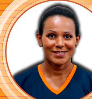
VICTÓRIA Caixa Vista Alegre