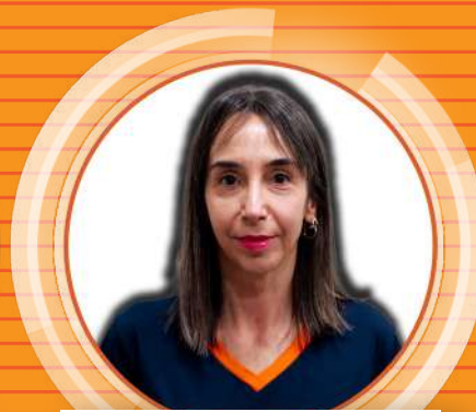
MARIENE Bradesco 013