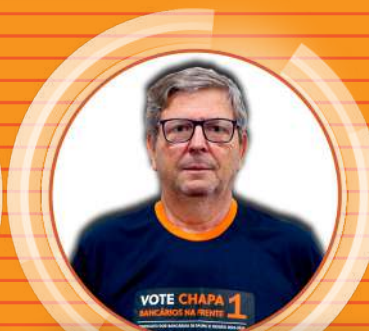
WAGNER Aposentado Itaú