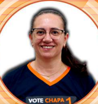
MÂRCIA Bradesco Lençóis